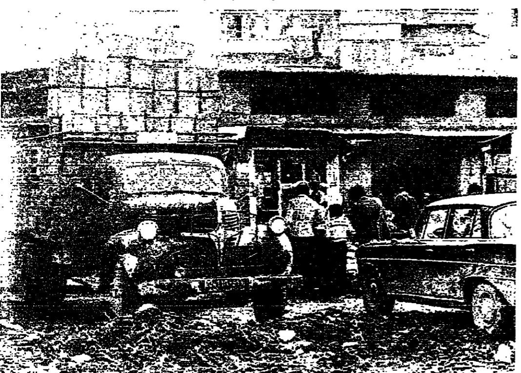
■ غياب عمال التنظيفات يزيد من قاذورات الشوارع الشعبية ■